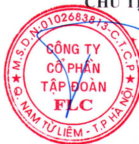
Trịnh Văn Quyết